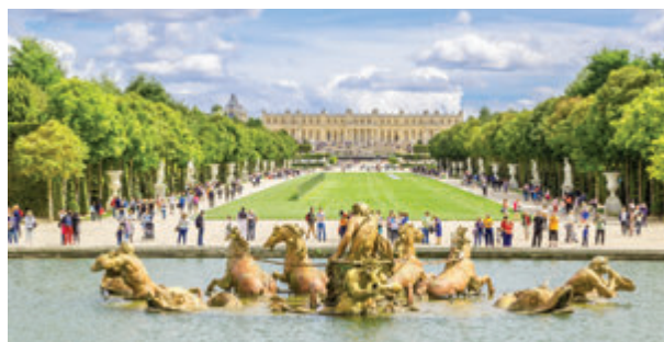
สวนแวร์ซายส์