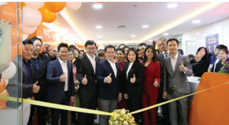
(ภาพเปิดสาขาเมื่อวันที่ 13 กรกฎาคม 2562)