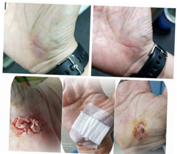
Testimonial - S Vera Gel