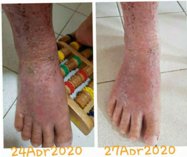
Testimonial - S Vera Gel

S Vera Gel ialah gel aloe vera yang berkesan untuk kulit, menggalakkan penyembuhan luka, analgesik, anti-radang dan menyuburkan kulit. S Vera Gel kelihatan seperti tekstur gel yang lutsinar, mempunyai haruman yang lembut dan cepat meresap ke dalam kulit. Sapukan ke seluruh muka dan kawasan badan.