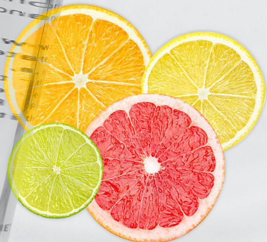
Minyak Pati Citrus

Penanggal solekan yang membersihkan kotoran, menjadikan kulit gebu, menghidrat dan mencerahkan kulit. Ia juga membantu dalam memulihkan tahap kelembapan.