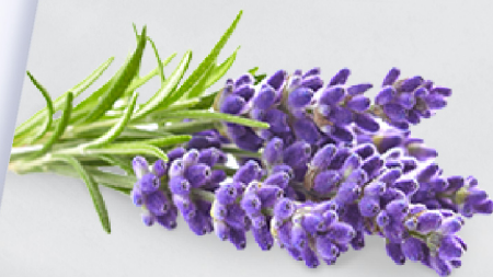
Minyak Pati Lavender