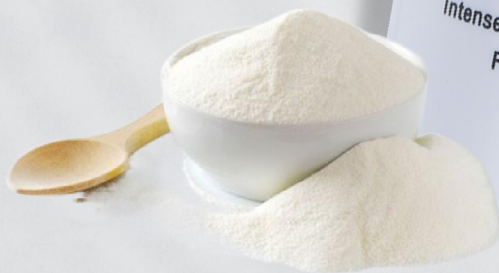
Gula Bio Sakarida